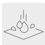
Resistente al agua