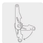
Mecanismo de rápida liberación