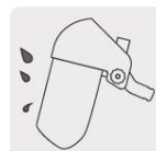
Protección contra impactos