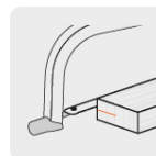
Corte a 180°