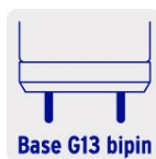
Base G13 bipin