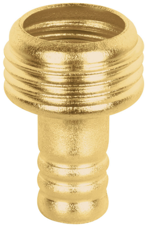
Conexión macho 3/4"