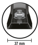
Soporte Calibre 16 (1.5 mm espesor)