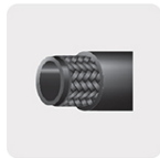
Manguera reforzada trenzada, 3 capas