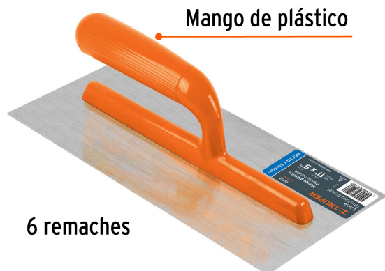
Mango de plástico